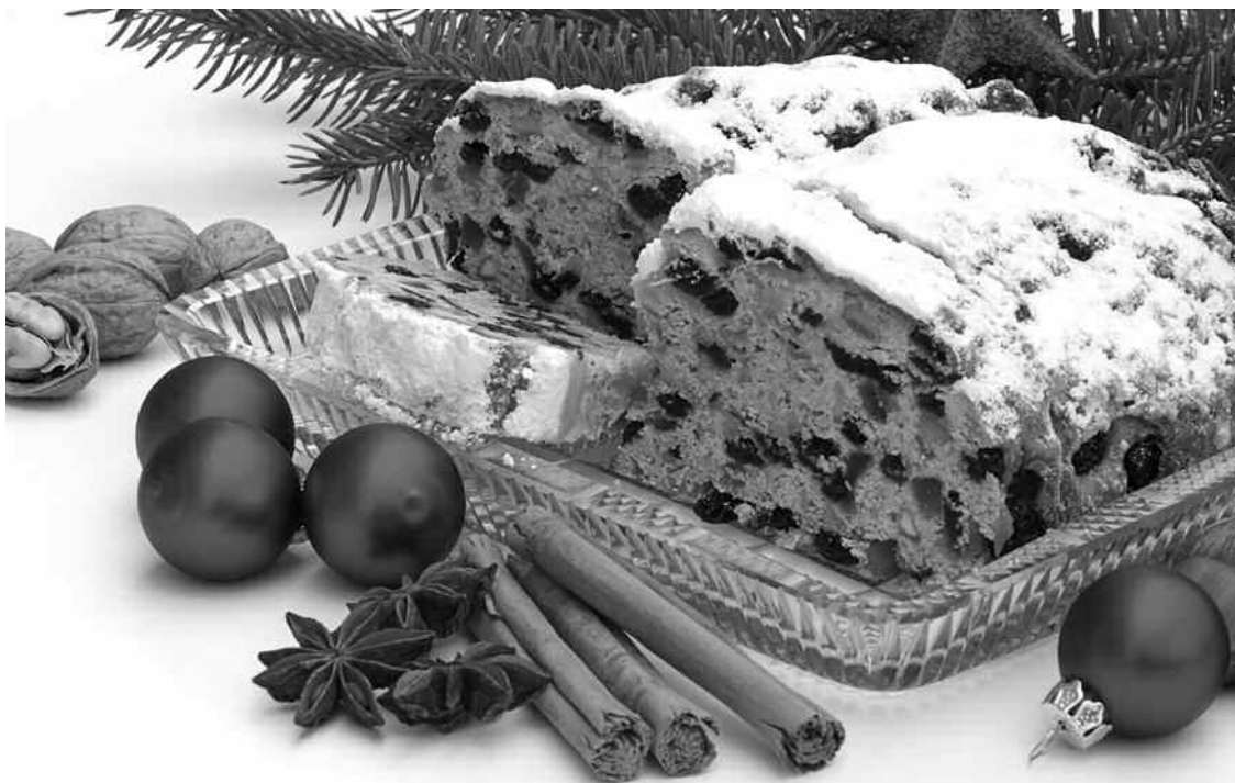
Lecker ... Weihnachts-Stollen

Nürnberg ist eine Stadt im Südosten Deutschlands.